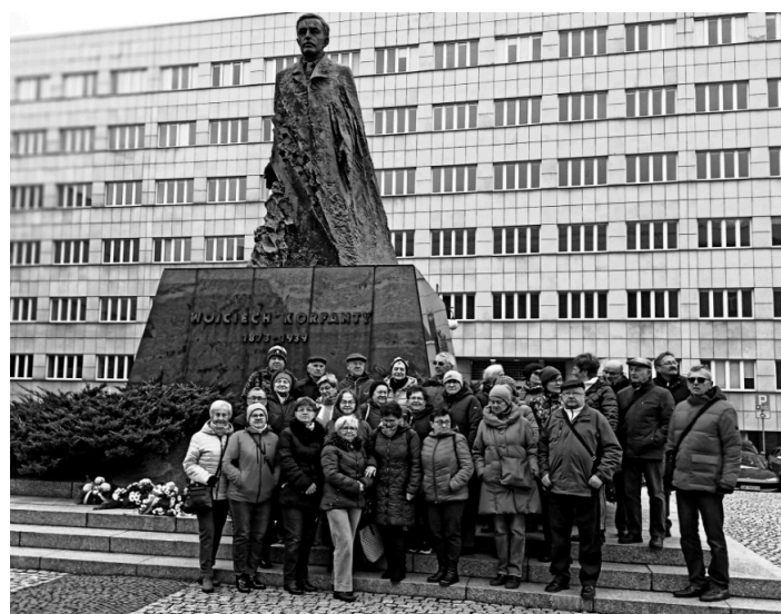
„Orlice Sokolice Heroski – Ślązaczek portret własny” - wyprawa do stolicy Śląska - Katowic

Składamy najserdeczniejsze życzenia urodzinowe grudniowym solenizantom!!!