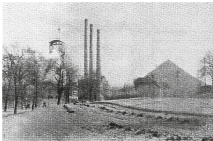
KWK Rydułtowy, widok od ul. K. Przerwy- Tetmajera

Składamy najserdeczniejsze życzenia urodzinowe marcowym solenizantom!!! A są to: