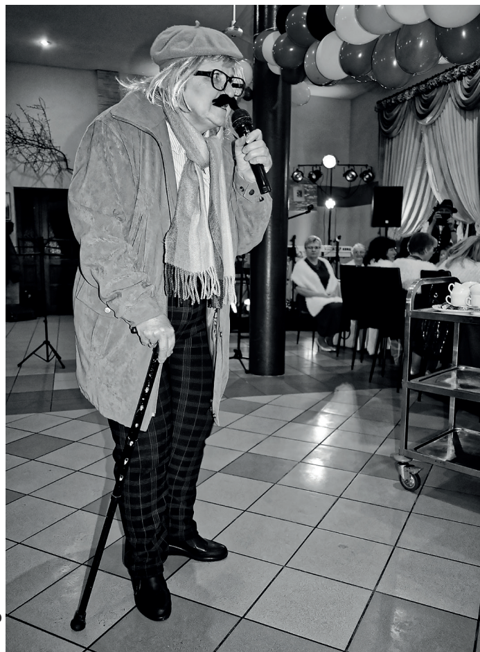
Dzień Kobiet w Cafe Finezja w Brzeziu