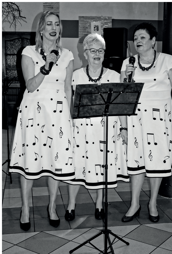
Dzień Kobiet w Cafe Finezja w Brzeziu