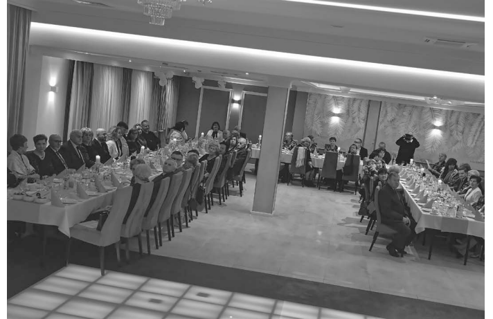
Zabawa karnawałowa TMR-u, „Stara Palmiarnia Mimosza”