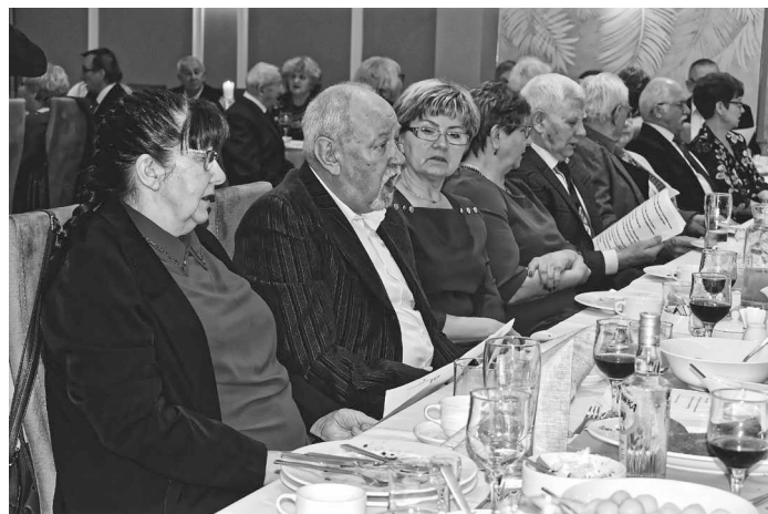
Zabawa karnawałowa TMR-u, „Stara Palmiarnia Mimoza”